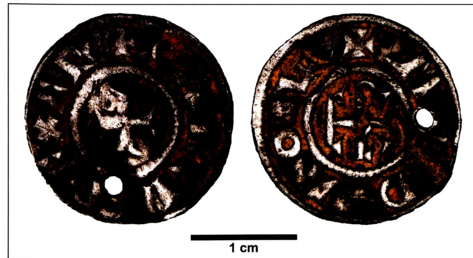
Abb. 1 Bennigsen FStNr. 37, Stadt Springe. Denar Karls d. Großen.

* Die Fundstellenbezeichnungen (Gemarkung + laufende Fundstellenummer) beziehen sich auf das landesweit gültige System des Niedersächsischen Landesamtes für Denkmalpflege.